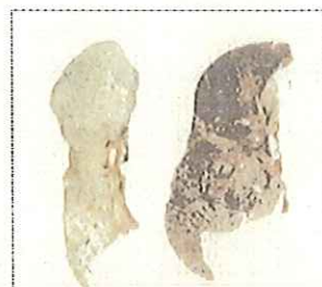
左) 正常な肺 右) じん肺に罹患した肺 (粉じんの吸入により肺が黒くなっている。)

現在、じん肺を治す根本的な治療がないため、じん肺にかからないための措置として、粉じんの発生源対策、局所排気装置等の適正な稼働、呼吸用保護具の適正な着用などにより、粉じんへの「ばく露防止対策」を徹底することが重要です。